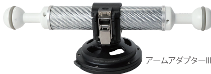
アームアダプターIII: AOIカーボンアーム