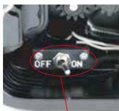
リークセンサースイッチ