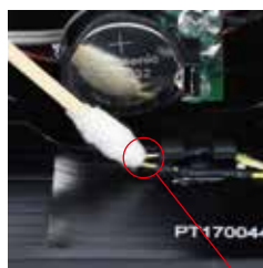
リークセンサー端子